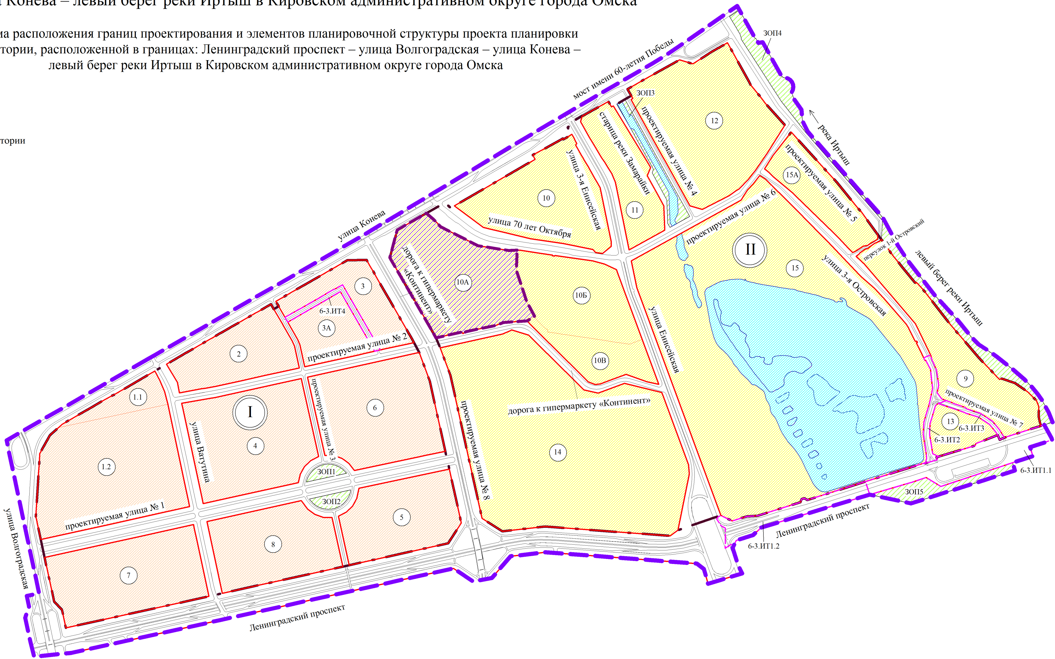
Экспликация зон элемента планировочной структуры № 10А планировочного района II